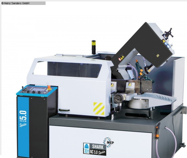
Elektrohydraulischer Gehrungsbandsägeautomat für Schnitte von 0° bis 60° links