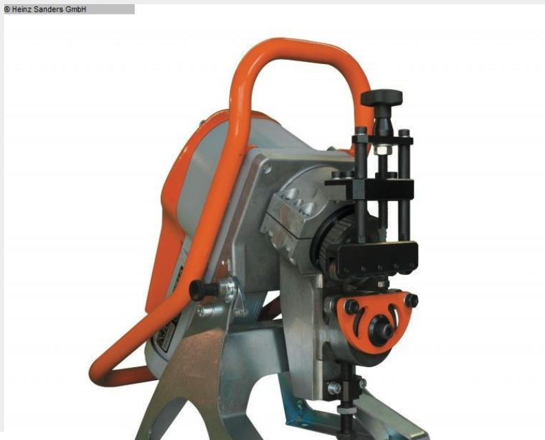
Anfasssystem UZ12 ULTRALIGHT - KIT 30° + 45° Maximale Fasenbreite 12 mm mit automatischem Vorschub

Die UZ12 ULTRALIGHT ist eine der leichtesten Anfassmaschinen mit automatischem Vorschub auf dem Markt. Dank seiner kompakten Größe und des geringen Gewichts eignet sie sich nicht nur für Werkstätten, sondern auch für Montagen. Die Maschine ist mit dem automatischen Vorschub ausgestattet und macht daher das Arbeiten mit der UZ12 ULTRALIGHT sehr komfortabel.